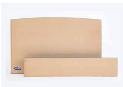
Una / Una Low

Kan in combinatie met volle lengte zijhekken, gedeelde zijhekken of zijpanelen